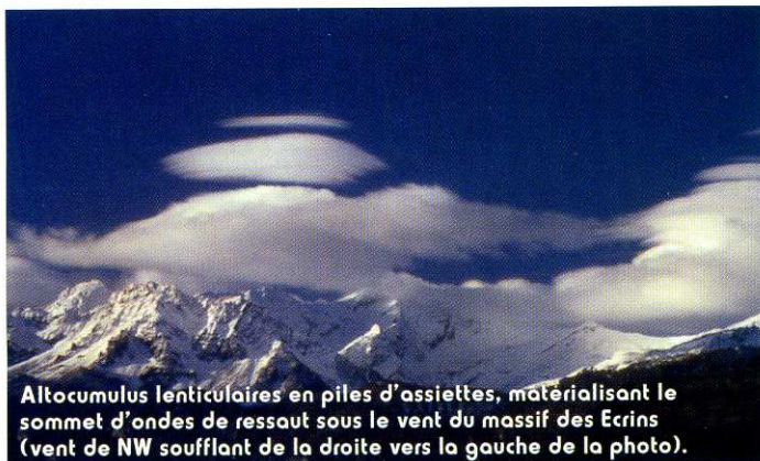
Alto cumulus lenticulaires en piles d'assiettes, matérialisant le sommet d'ondes de ressaut sous le vent du massif des Ecrins (vent de NW soufflant de la droite vers la gauche de la photo).

Partout dans le monde où un afflux puissant d'air humide rencontre un relief important, on constate le même effet de fœhn. Les Indiens des Rocheuses l'appellent le Chinook et ceux des Andes la Zonda. ■